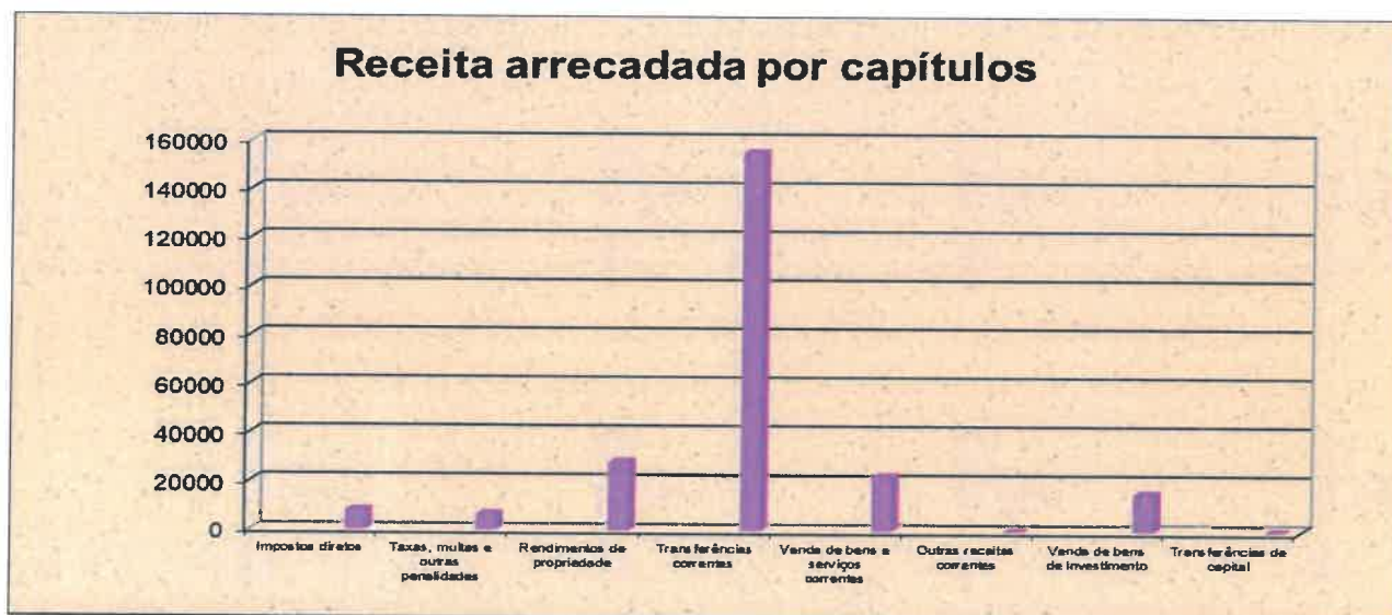
Gráfico n.º 1